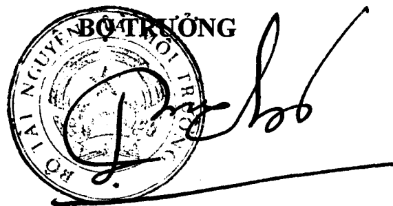
Phạm Khôi Nguyên